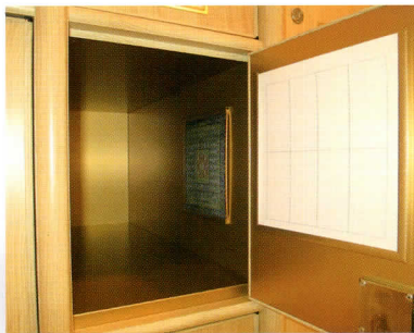
■光明殿特別納骨室(内部)