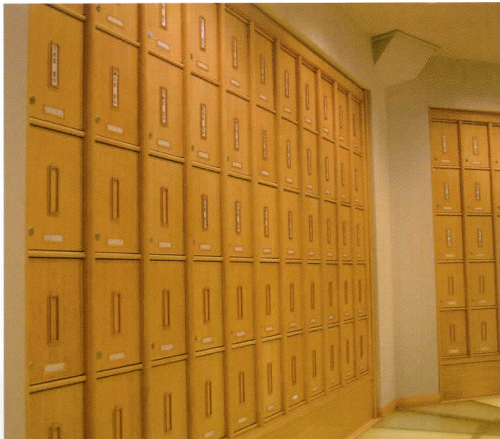
■光明殿特別納骨室(2階)