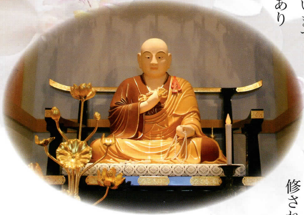
■本尊弘法大師坐像