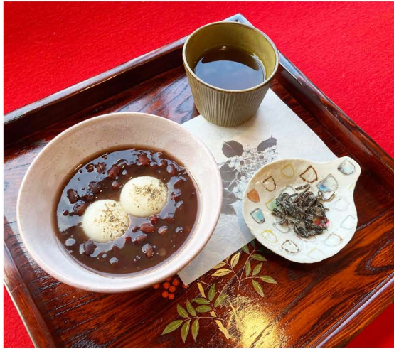
ぜんざい ¥600 冷やしぜんざい ¥600