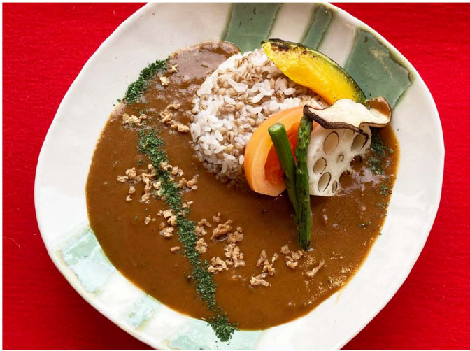
大豆ミートと季節野菜の カレー (ダイシモチご飯) ¥1,000 ※白米に変更可

魚・肉・玉ねぎを使わない精進カレーです。 ベジタリアン・ヴィーガンの方にも 召し上がって頂けるカレーです。