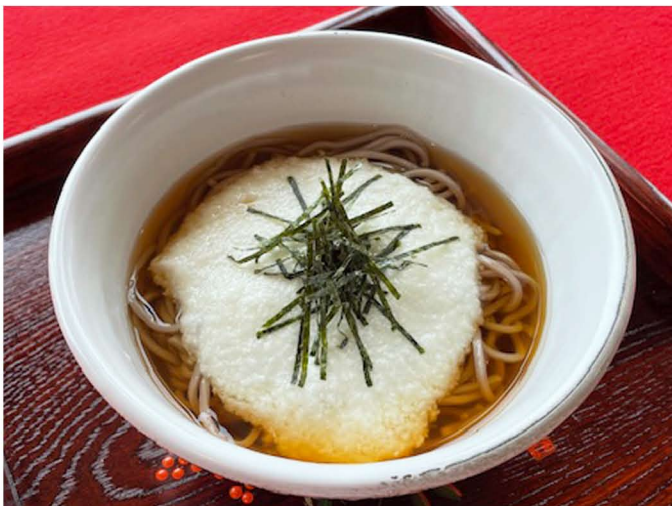
山かけ蕎麦 (温・冷) ¥750

お肉が欲しい方のための丼です。 脂の美味しい豚肉のあぶりを ダイシモチ入りご飯と 一緒にお召し上がりください。