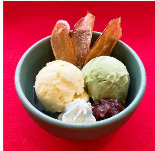
おいもチップスアイス ¥600 +白玉入 ¥650