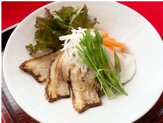
豚丼 (ダイシモチご飯) ¥1,000 ※白米に変更可

魚・肉・玉ねぎを使わない精進カレーです。 ベジタリアン・ヴィーガンの方にも 召し上がって頂けるカレーです。