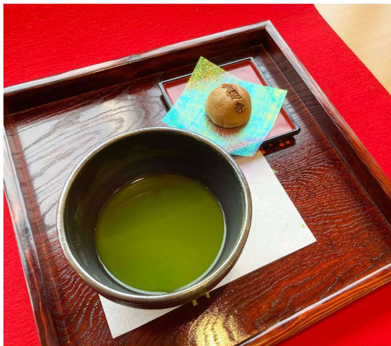
抹茶セット(お菓子付) ¥600