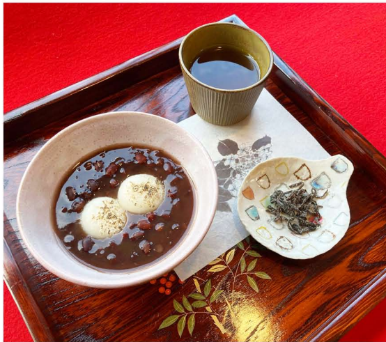
ぜんざい ¥600 冷やしぜんざい ¥600