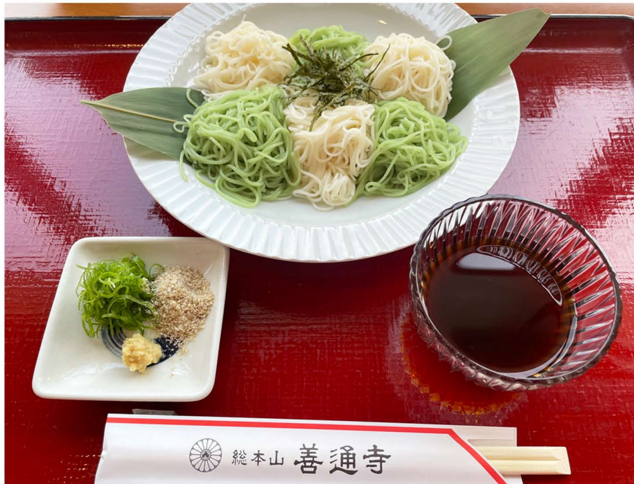
小豆島手延素麺・オリーブ素麺 ¥1,000 (1日10食限定)